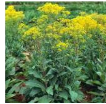
Pastel des teinturiers