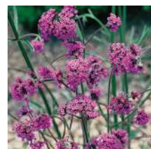
Verveine de Buenos Aires